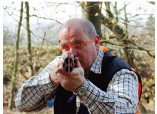
Die Augenachse sollte horizontal sein

gen Maße gebracht und das Schaftfinish wieder hergestellt.